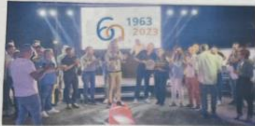
Un momento dell'evento della Rivogas per la celebrazione del sessantesimo anniversario della società casalese