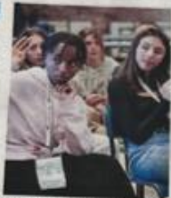
STUDENTESSE PRIME MINISTER

In arrivo due nuovi appuntamenti per le trenta studentesse della scuola di politica per giovani donne "Prime Minister" di Asti, promossa dalla Fondazione Giovanni Goria. Dopo la passata estate riprendono le lezioni, che a settembre avranno come filo conduttore i linguaggi e le tecniche del teatro. Quanto può essere difficile parlare in pubblico? Quanto può essere limitante quella che possiamo definire come "Ansia da microfono"? Sabato 16 settembre l'attrice Susanna Nuti esplorerà con le studentesse di Prime Minister Asti le diverse tecniche utilizzate dagli attori per facilitare il public speaking. Uso della voce, la gestualità, i cambi di ritmo e di toni, l'importanza di conoscere il pubblico: ecco alcuni argomenti che verranno trattati durante il laboratorio. La testimonial condurrà l'incontro intitolato "Le tecniche attoriali per il public speaking".