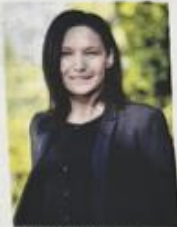
COUNTESSOR CHIARA CAUCINO

Cassazione regionale Caucino (Pittliche della Casa) lancia un appello ai Comuni piemontesi per aderire ai piani dell'abbattimento delle barriere architettoniche. «Nonostante gli ingenti sforzi adottati in questi anni, quello dell'abbattimento delle barriere architettoniche, specie nelle aree più degradate, rimane un problema ancora da risolvere» - commenta - Per questo motivo credo che la Regione e i Comuni debbano fare il massimo per rendere sempre più agevole la